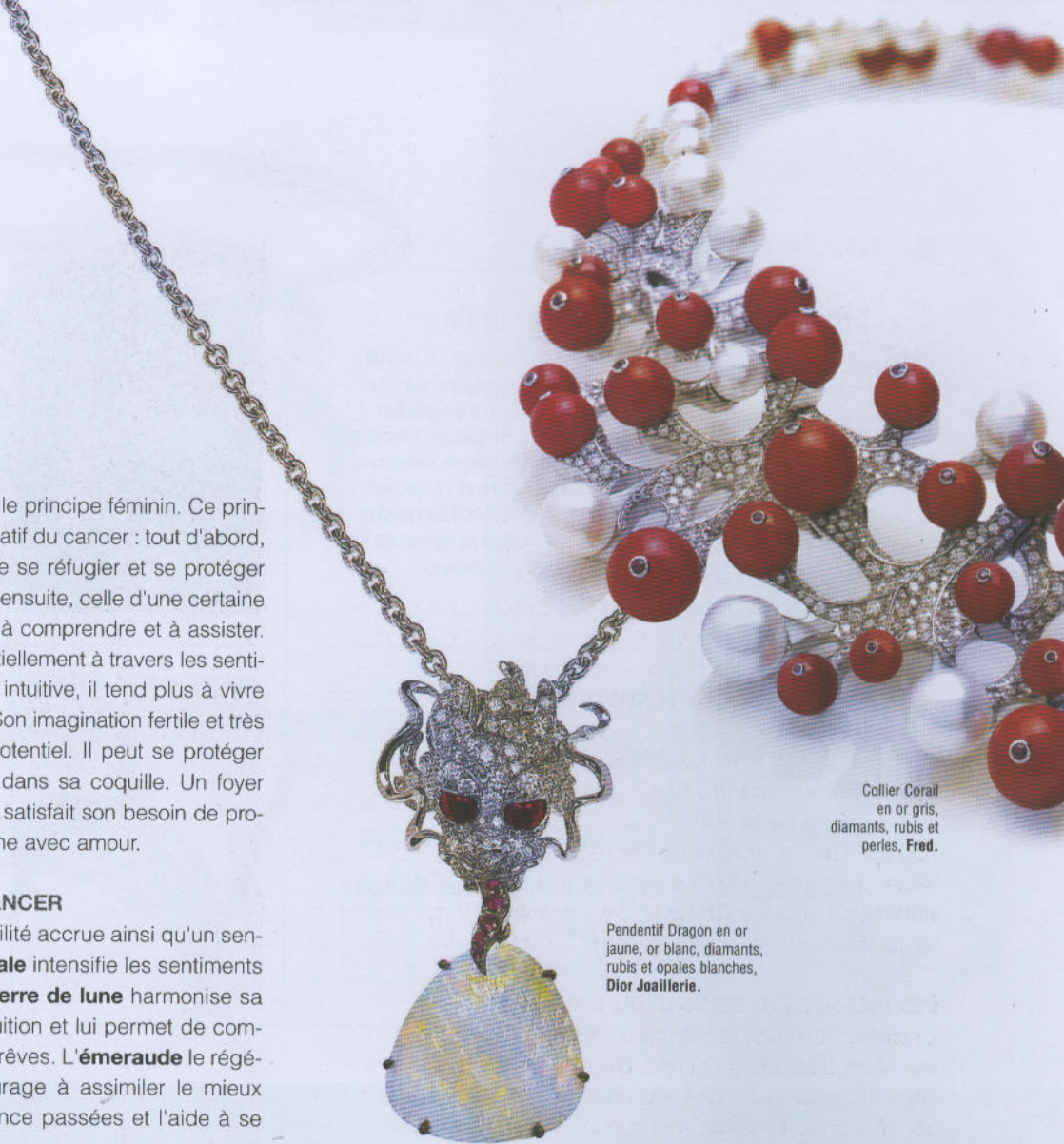
Collier Corail en or gris, diamants, rubis et perles, Fred.

Le corail apporte au cancer une stabilité accrue ainsi qu'un sentiment de solidité et de sécurité. L' opale intensifie les sentiments profonds et vivaces du cancer. La Pierre de lune harmonise sa vie affective, elle approfondit son intuition et lui permet de comprendre le message véhiculé par ses rêves. L' émeraude le régénère et le rajeunit. La perle l'encourage à assimiler le mieux possible toutes les traces de souffrance passées et l'aide à se libérer de ses blocages émotionnels.